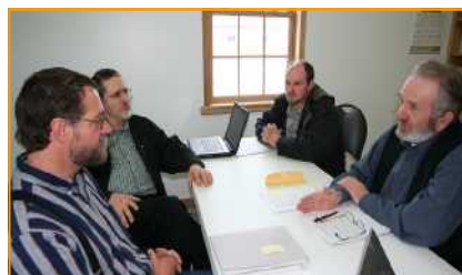
Treffen mit Hutterer-Leitern

Auch sie fragten sich letztes Frühjahr was Gott mit ihrem Leben vorhatte. Und genau in diese Situation hinein sprach Gott zu unseren beiden Familien. Im Rückblick können wir nur darüber staunen , wie der Herr uns zusammengeführt hat und durch viele Dinge bestätigte, dass eine Übersetzung für die Hutterer genau jetzt „dran“ ist. Nun beten wir, dass sich Vertreter aus den verschiedenen Gruppen zur Mitarbeit im Übersetzungskomitee bereifinden werden.