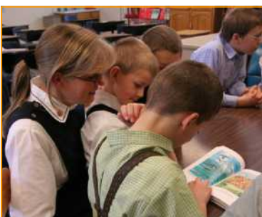
Das erste hutterische Bibelkinderbuch ist gedruckt.*

Nun beten wir, dass sich Vertreter aus den verschiedenen Gruppen zur Mitarbeit im Übersetzungskomitee bereifinden werden.